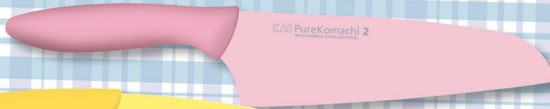
PureKomachi 2 HIGH CARBON STAINLESS STEEL