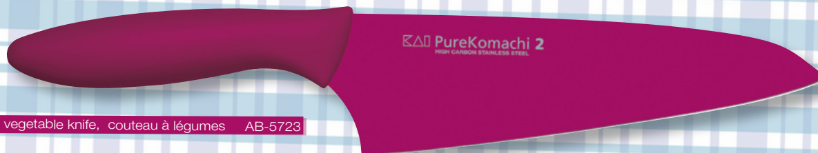
PureKomachi 2 HIGH CARBON STAINLESS STEEL