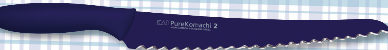
PureKomachi 2 HIGH CARBON STAINLESS STEEL