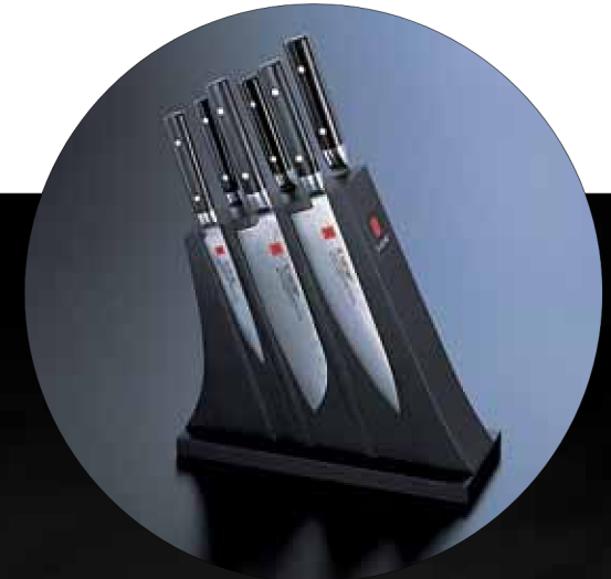
nr. 81006 Kasumi hnífablokk